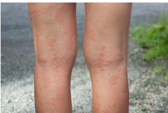
Zdjęcie: pokrzywka na tylnej powierzchni nóg (iStock).

Ostra pokrzywka może wystąpić we wszystkich grupach wiekowych, zarówno u mężczyzn, jak i u kobiet. Około 15-20 % populacji doświadczy ostrej pokrzywki w pewnym momencie swojego życia.